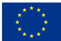
Unione europea Fondo sociale europeo

http://www.uep.corep.it/voucher/catalogo.html